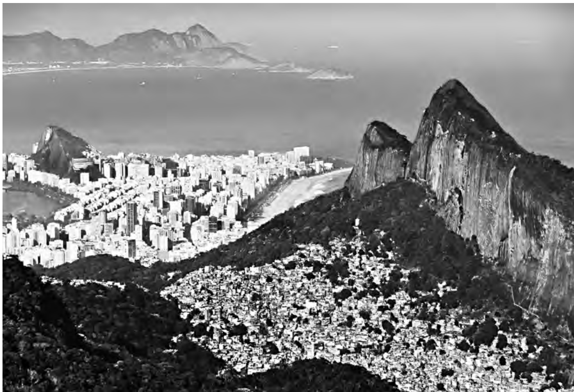
Вид на прекрасный Рио-де-Жанейро с горы Фавела. От названия горы и слово «фавелы» – районы трущоб

Население мира – около 8 млрд, рост по сравнению с 2004-м – на 25%. А вот племя миллиардеров – 2668 чел., рост за то же время – почти в 5 раз. Из них в США – 735 на 332 млн жителей (1 на 450 000), в Германии – 134 на 83 млн жителей (1 на 620 000), в Швеции – 45 на 10 млн (1 на 220 000), в РФ – 88 на 146 млн (1 на 1 660 000). Кстати, это был самый неудачный момент для замера. С тех пор российский фондовый рынок, несмотря на специальную операцию, сильно прибавил, рубль резко подорожал в отношении к доллару, а число «форбсов» выросло до 99. В то же время среди 1 400 000 жителей Африки на сей раз не оказалось вообще ни одного миллиардера.